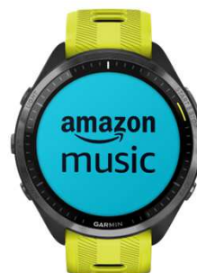
Garmin Music 4