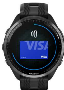
Garmin Pay 1