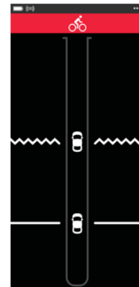
Fahrzeug nähert sich mit hoher Geschwindigkeit